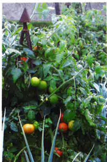
Tomates se développent sur des structures alliques en forme de triangles - © D.R.

Piments rouges, et pommes Calville sont parmi les variétés qui cohabitent dans ce jardin - © D.R.