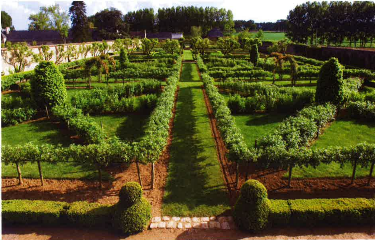
Afin de donner du relief au potager, les propriétaires ont souhaité apporter une verticalité végétale dans chacun des carrés

L allée qui invite au château de Villaines ménage une surprise totale: les bâtiments se dévoilent au dernier moment car Marc Forissier a fait réouvrir un chemin forestier désaxé par rapport à la demeure afin que cette dernière ne puisse être visible de la route.