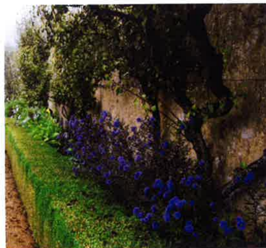
Les poiriers palissés en espaliers sont bordés pas des buis